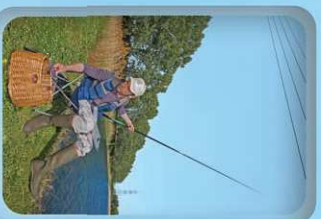
Utilisation d'une canne télescopique